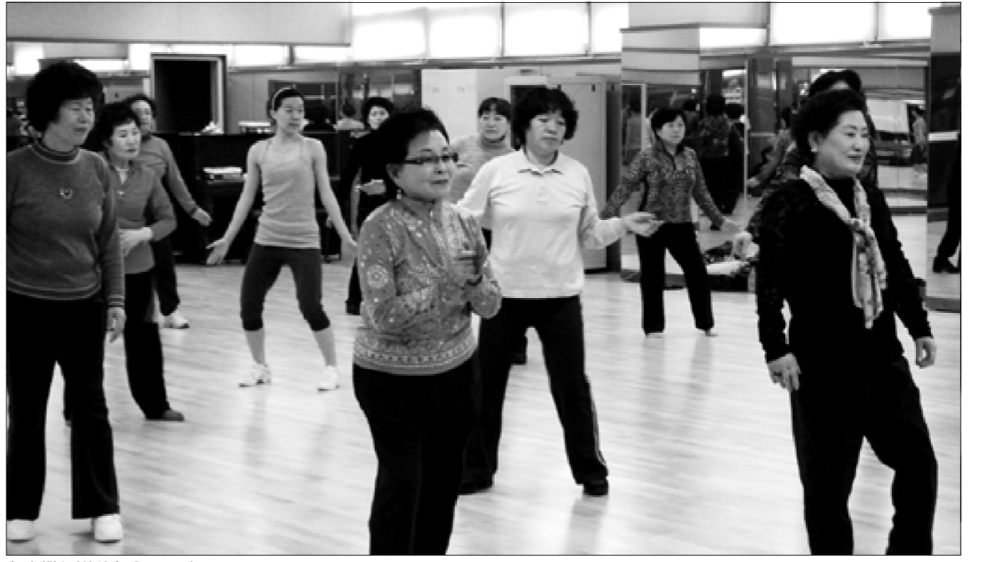
◆평생학습관의 실버교육 프로그램.

참여하지 못하는 많은 시민을 위한 사이버 강좌의 학습 참여도 향상을 위해 ON-OFF LINE 연계를 활성화하고 학위 취득을 원하는 시민들을 위한 학점은행제 도입도 추진해 나갈 예정이다.