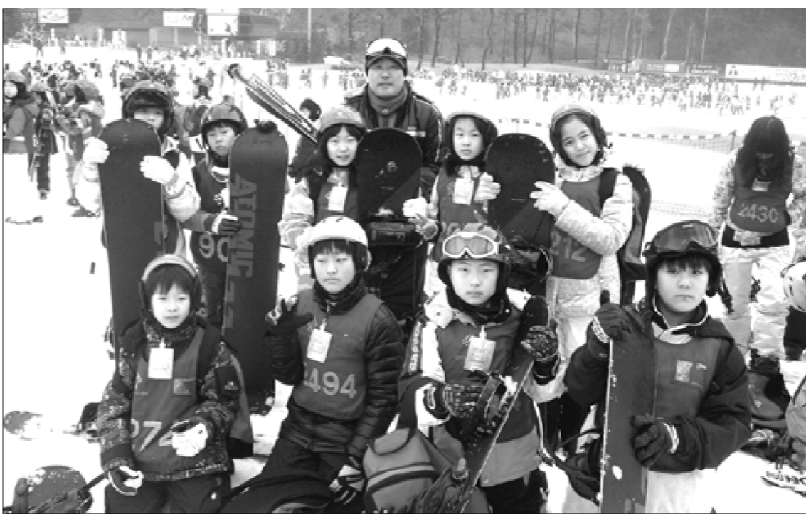
◆ 인천연수초등학교 청소년 단체들이 연합 동계캠프에 참가해 몸과 마음을 튼튼히 하는 시간을 가졌다.